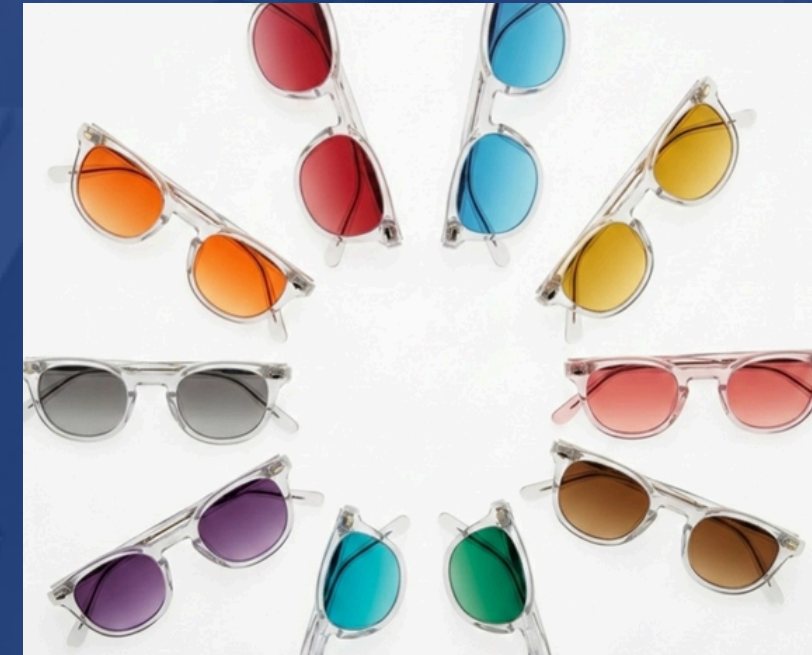
Gafas de Sol