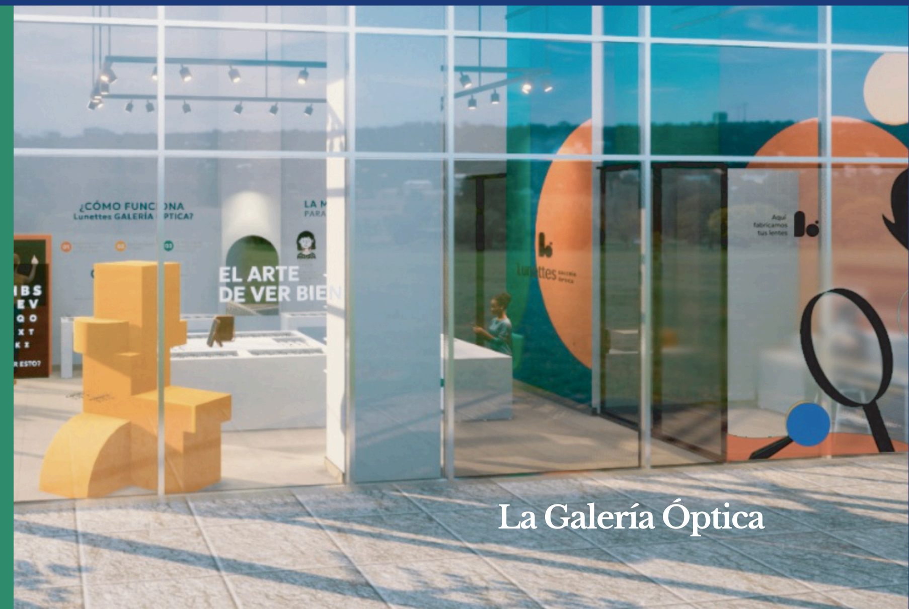
La Galería Óptica

Kiosco compacto en puntos de alto tráfico. App propia en iPad para recomendación personalizada de monturas. Escalable y subfranquiciable.